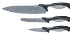
Komplet noży 3 elementy

nóż szefa kuchni - 20 cm nóż do warzyw i owoców - 11,5 cm nóż do obierania - 9 cm