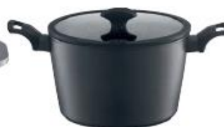
Garnek wysoki 24 cm