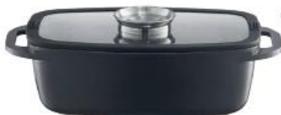
Brytfanna z odlewane aluminium z Aroma Knob System 32×21 cm