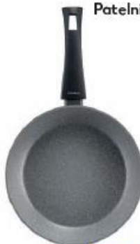
Patelnia 28 cm