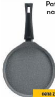
Patelnia do naleśników 26 cm