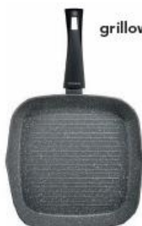
Patelnia grillowa 28 cm