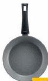
Patelnia 20 cm

Warstwa kryjąca Warstwa podstawowa Korpus naczynia