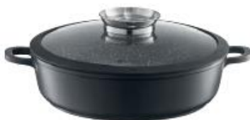
Patelnia głęboka z odlewane aluminium z Aroma Knob System 28 cm